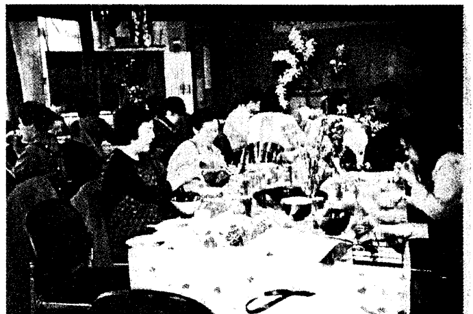
丸亀市4協婦人部交流会