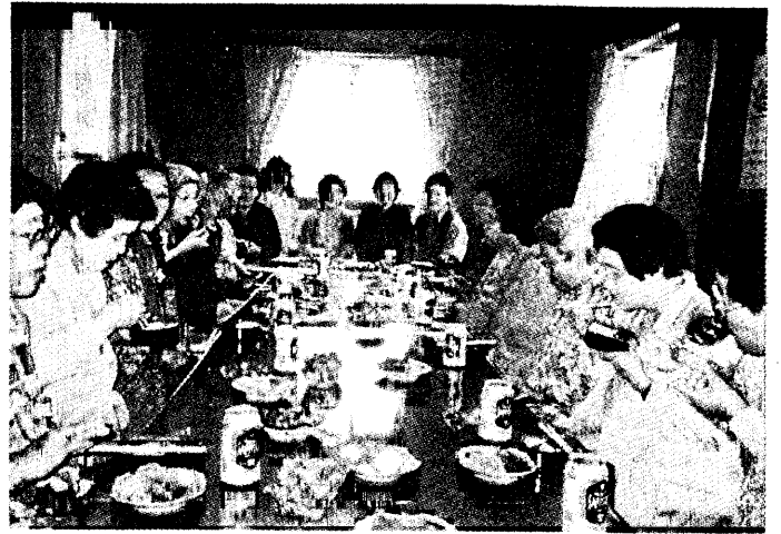
ふれあいグループ