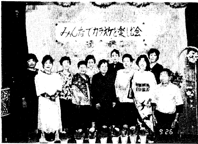
カラオケグループ