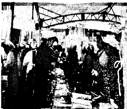
農林水産フェスティバル