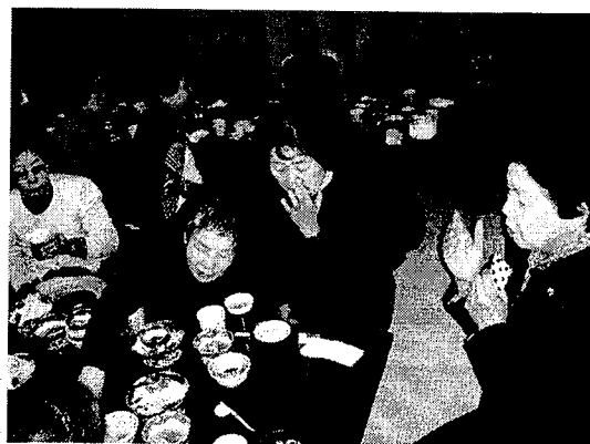
写真4. 昼食をとりながら意見交換会

作ったノリの佃煮を食べていただき、おいしいと好評でした。またノリの佃煮の作り方が参考になった。生ノリの扱いに興味があって、とても勉強になった。などの意見が多かった。なかには、もっといろいろなお話がしたかったなどの今後の参考となる意見もあった（写真4）。