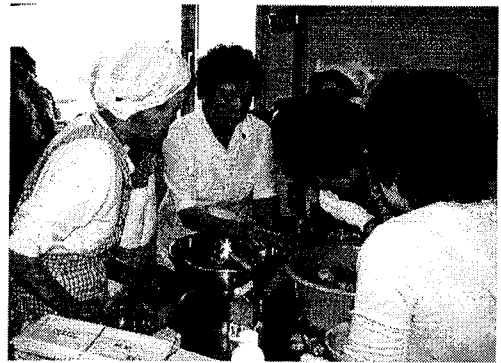
写真1. アサリのむき方を指導