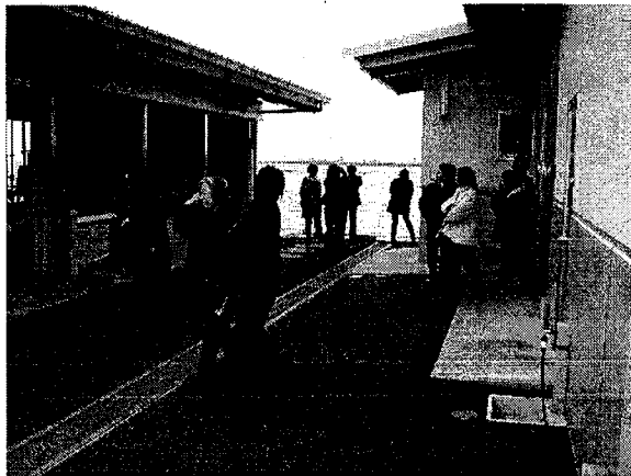
写真3. ノリ加工施設見学

この交流会では、木更津地区の金田漁業協同組合のノリ加工施設見学・直販所見学を通じて、ノリの出来るまでを学ぶ、おいしいノリの選び方や食べ方を学ぶ、そしておいしいノリを購入してもらうことを目的とした（写真3）。アンケート結果から、参加者は、見学について「勉強になった」「また来てみたい」など3割から5割程度であった。直売については、8割程度の方が「近くで購入できたら、いい」と感じ、「今後も来てみたい」と感じたのは3割程度であった。