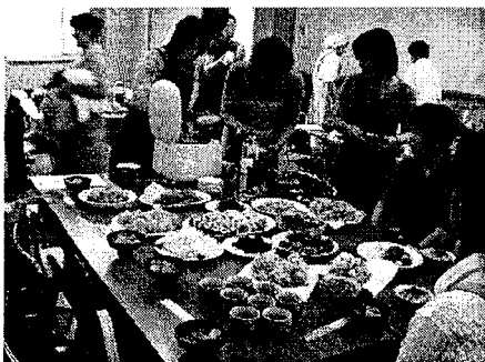
写真2. 料理講習会で皆さんと一緒に作ったアサリ・バカガイ料理