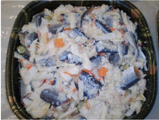
湾中女性部特製「飯寿司」

女性部員は84名で、後ほど詳しく説明するが女性部オリジナルの加工品や漬物を生産・販売する事業活動や潮干狩りのイベント、交通安全の啓蒙運動への参加、植樹、飯寿司やお魚料理教室などの組織・文化活動をはじめ、干潟の耕うん、有害生物の駆除も行っている。