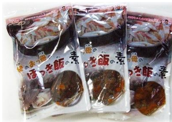
俺のおっ母のほっき飯の素