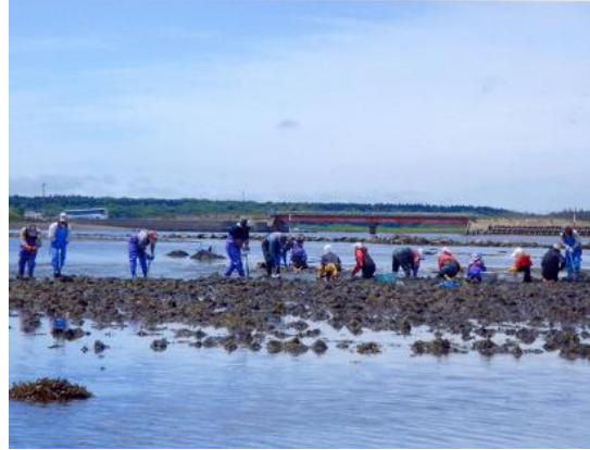
干潟の耕耘の様子