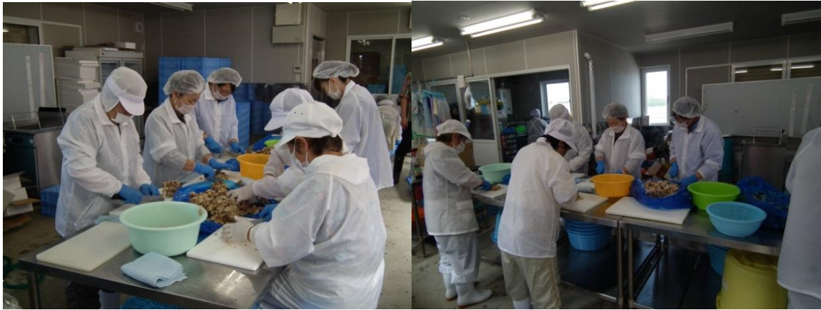
「ほっき飯の素」作成作業風景

やっと行き着いた先が、具材は小さ目にするにより具材へのタレの浸み込みを防止しかつ、パック詰めの際も味に偏りがなく、ほぼ均等に分けることが出来ると解った。