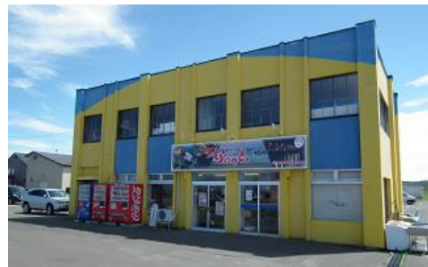
湾中漁協直売店「かおっと」