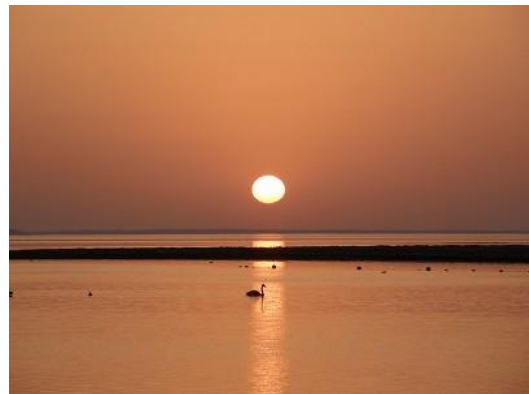
根室湾に沈む夕日