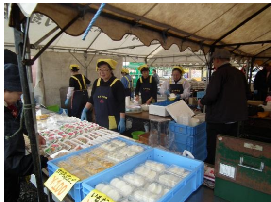
かおっと感謝祭の様子

今後は、具材のバランスを考え価格をもっと控えて気軽に食べられる工夫など、「味」以外にも取り組まなければならない課題は沢山ある。