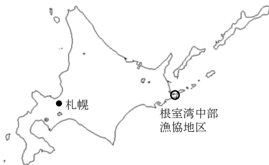
根室湾中部漁協地区の位置

また、根室は日本一早い「日の出」が有名であるが、根室湾に沈む夕日も美しく、夕日を眺めながら一日の終わりを感ぜられる場所でもある。