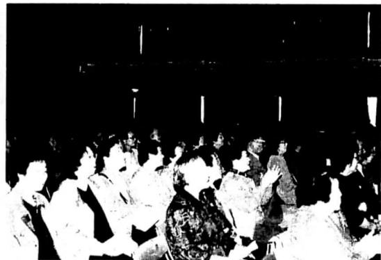
ふるさと演芸会（左：女性部による踊り、右：大勢の観客）

その他の行事には毎年9月の「敬老会」や「雷神社祭典大演芸会」、平成12年から始まった島の大人達による「島民合同運動会」があり、ある時は主役として舞台の上で唄や踊りを披露し、またある時は裏方として運営の仕切り役を担当しながら、交流行事には毎回欠かさず参加し、多彩な活動を行っている。