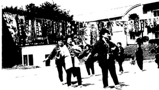
交流行事における活動（左：雷神社祭典大演芸会、右：島民合同運動会）

これらの取り組みによって、私達は高齢者をはじめ島民に次第にかつての活気と明るさが戻ってきたと実感している。この効果は島内の活性化にとどまらず、来島者が安心して滞在できる環境づくりにも大きく貢献するものであり、女性部活動がその一助となれたことは大きな幸せであった。これからも、私達は島民の心から少しでも不安を取り除き、皆が日々明るく暮らしていけるよう、様々な活動で島を盛り立てていきたいと考えている。