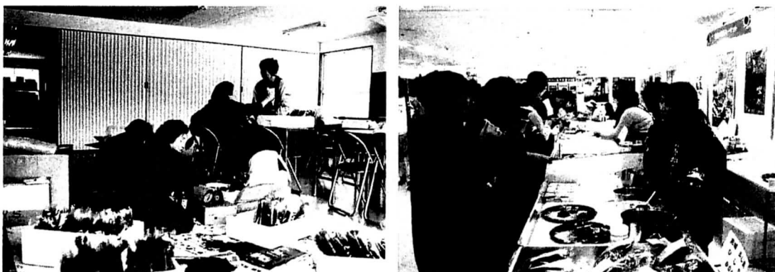
女性部の活動状況（左：フノリ袋詰め、右：離島振興事業「アイランダー2008」出展）

主な活動は、地産地消の取り組みとして「石巻しみん市場」でのヒジキ・フノリの直売や海浜清掃等の環境保全活動、海難遺児募金運動、共済の加入推進運動等に取り組んでいる。女性部員は地域の婦人会にも所属しており、消防・防災活動や島内のお祭りはもちろん、牡鹿地区の各種イベントにも毎回参加するなど、地域行事の中核的な役割を担っている。