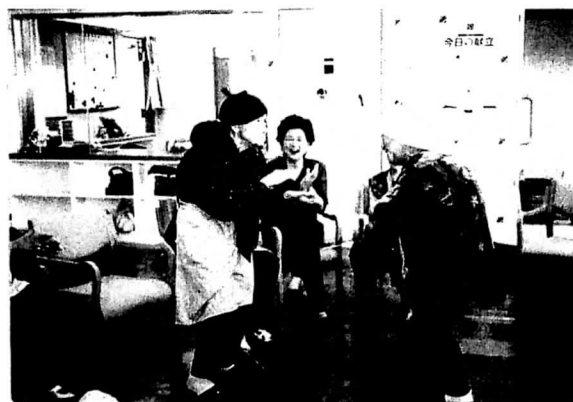
デイサービスセンターでの活動

デイサービスセンターの開所後は、女性部の役員20名がホームヘルパー3級の資格を取得し、月・水・金の週3回、毎回2人ずつが交代で参加して食事や入浴等の提供、日常生活訓練の補助、唄や踊りのレクリエーション等、多彩なサービスの提供に努めた。