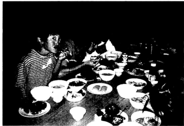
「あじ島冒険楽校」の夕食風景 (アワビ、ウニ、鯨料理がずらり！)

食卓を飾るのは、やはりアワビやウニといった島の豊かな水産物であり、これらは女性部員が素潜りで漁獲したものである。決して若くはない女性部員にとって、素潜り漁は体力的、精神的に厳しいものがあるが、女性部員から見れば、参加した子供達は孫同様に可愛らしく、「せっかくの機会だから島の新鮮な水産物をたくさん食べさせてあげたい。」と、普段にも増して漁や調理に精を出すのである。