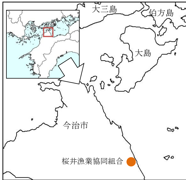
桜井漁業協同組合 地図

なお、今年（2024 年）は瀬戸内しまなみ海道開通 15 周年を迎える記念の年に、愛媛県と広島県を結ぶ「瀬戸内しまなみ海道」を舞台に国内外から 7,000 人以上参加した国際サイクリング大会が開催されるなど「サイクリストの聖地」として、広く世界に発信している。