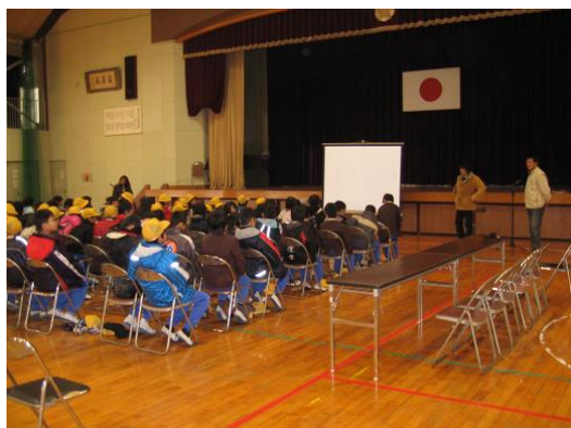
体育館での出前事業

今回のアマモ場造成に際し、海の環境や藻場の役割を理解してもらうために、海浜清掃でタッグを組んでいる環境NPOと共に地元桜井小学校の4年生（88人）を対象に出前授業を行った。小学校5年生から第1次産業についての学習が始まると聞いていたので、予習にもなるのではと考えたのである。体育館での授業の後は全員そろって海岸で種子入りワッシャー（200個）の種まき体験をしてもらった。