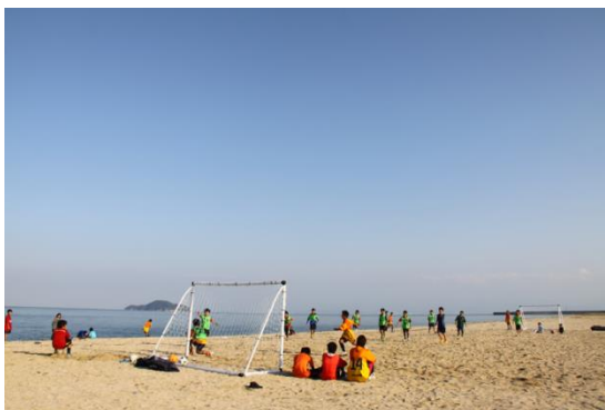
恒例のビーチサッカー

また、海浜清掃以外にも鹿児島大学の教授や沖縄県の環境NPOを講師に招き、地元の公民館で海洋漂着物や陸上から流入するゴミ等の講座を、不定期であるが開催している。