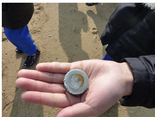
アマモの種入りワッシャー