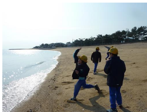
満潮だったので遠くへ