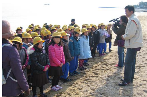
砂浜にて種まき（ケーブルテレビも取材）