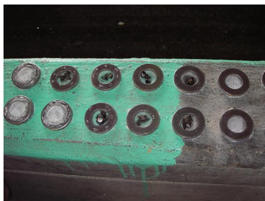
ワッシャー（中に入れている黒い物が種）

結果はどちらも発芽したが、ワッシャーを使用した方が波浪の影響を受けにくいいため良いのではとの印象であった。