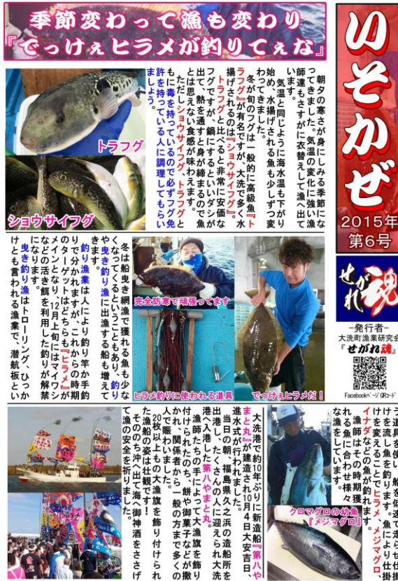
図5 いそかぜ 2015年 第6号 (表)

せがれ魂を続けるうちに、インターネットやフェイスブックを使っていない人にも魚や漁業を身近に感じてほしいとの思いが強まり、平成26年7月から広報紙「いそかぜ」を発行している（図5～6）。中身もせがれ魂で人気のあった記事をピックアップしたり、魚や浜言葉の解説コーナーを作ったりと、自分たちらしさが存分に盛り込まれたつくりになっている。大洗町漁協直売店「かあちゃんの店」店内外に掲示しているほか、近隣の商店などで掲示してもらったり、大洗町のホームページにも掲載してもらっている。