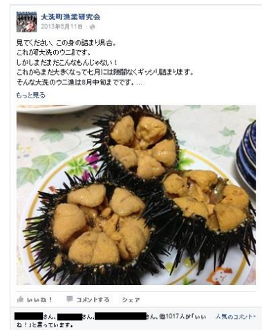
図3 人気のウニ記事

ページに対する「いいね！」の数も着実に増えていった（図4）。現時点で1400以上の方から「いいね！」をいただいているが、このたくさんの方のせがれ魂ファンを起点に、その友人、さらに友人の友人と、情報が次々に広がっていく仕組みになっており、私たちの思いがたくさんの人に伝わっている手応えを感じている。なお、記事別のアクセス数としては、多いもので約2万回のアクセスがある。もちろん「いいね！」やアクセス数のために活動しているわけではないが、こうした数値は目に見えるものとして、大きな励みになっている。