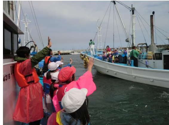
写真11 乗船・船曳漁体験

以前から年に何回かは実施していたが、大洗町との関係が強化され、実際に参加した子供たちや教師の口コミで評判になった結果、今では町の全小学校で、私たちの漁業体験が取り入れられるようになった。漁業の町大洗の漁業者として、この流れを絶やさず、引き続き頑張っていきたい。