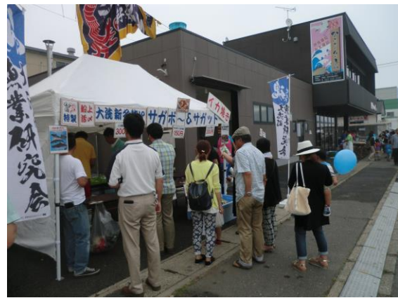
写真9 ホシザメ加工品試験販売