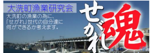
図2 初代トップ画像

平成 24 年 5 月に研究会のフェイスブックを立ち上げた。研究会員のほとんどが漁業者の跡継ぎ、つまり「せがれ」であり、その私たちの思い、魂を伝えていく場所として、ページの名前は「せがれ魂」に決めた(図2)。