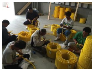
写真6 海水浴場浮標づくり