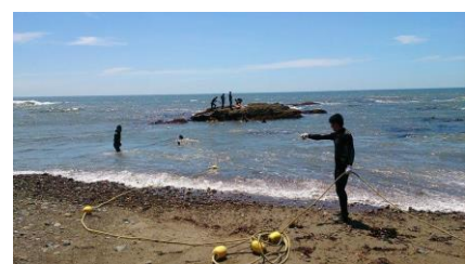
写真7 海水浴場浮標設置