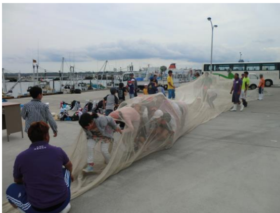
写真10 漁具解説・網くぐり体験

また、魚や漁業のPRの必要性を感じるきっかけとなっていた漁業体験についても、あらためて力を入れた。漁業の町大洗として、地元の子供たちには魚や漁業を知ってほしい、知らせたい。その思いを大洗町に伝えていくとともに、せがれ魂とそこから展開した活動で自分たちの本気度を示すことで、あらためて大洗町との関係を強化していった。また、漁業体験の内容についても、子供たちの反応を見ながらクイズの内容や漁具の説明の仕方、漁獲物の紹介の仕方を工夫していった（写真10～11）。