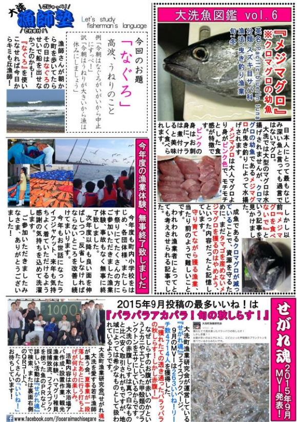
図6 いそかぜ 2015年 第6号 (裏)