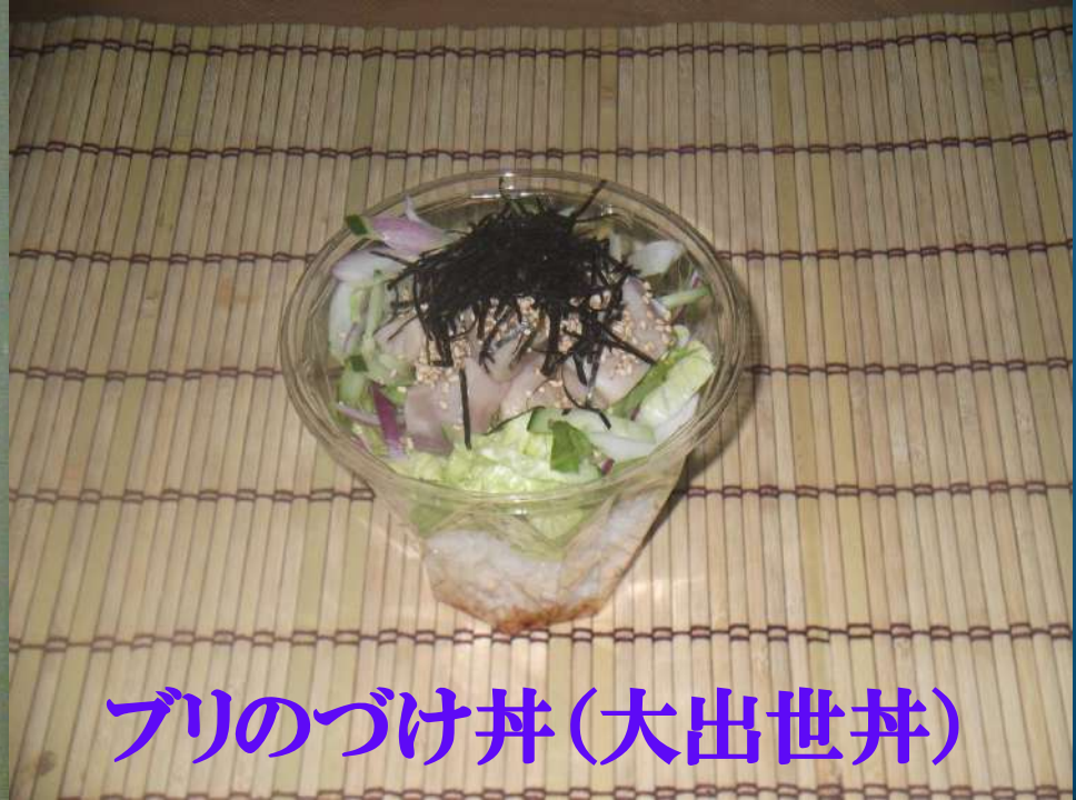
ブリのづけ丼(大出世丼)