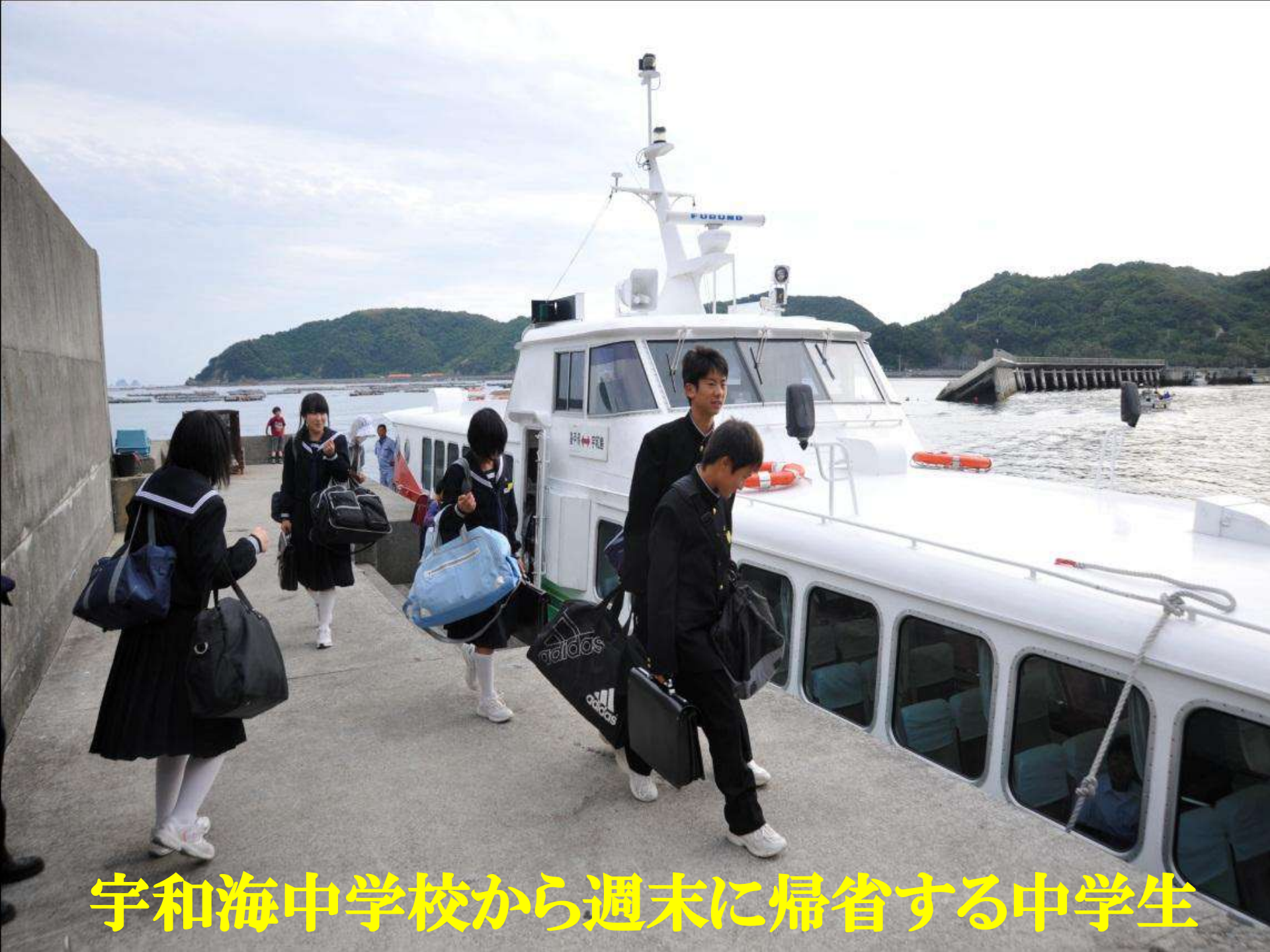
宇和海中学校から週末に帰省する中学生