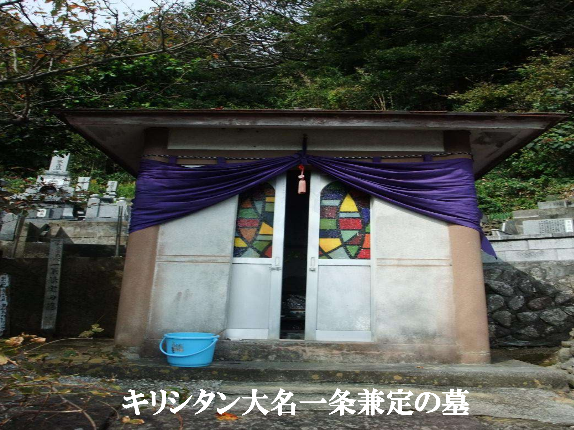
キリシタン大名一条兼定の墓