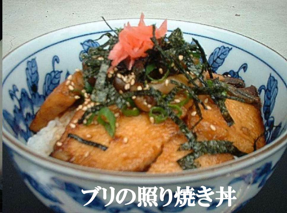
ブリの照り焼き丼