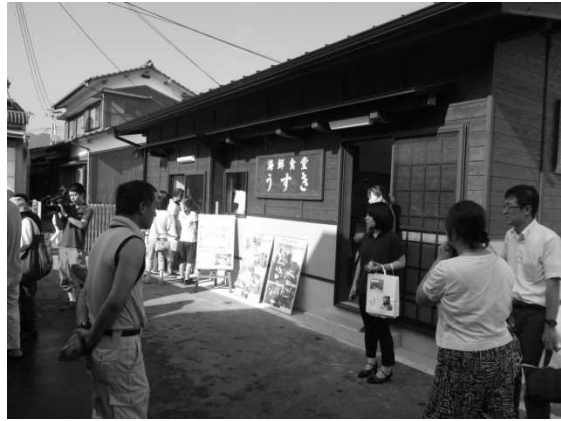
図8 新設された海鮮食堂うすき

また、2013年3月9日からは女性部員が臼杵産魚を用いた朝食の提供を開始し、ワンコイン(500円)で気軽に食べることができる海鮮丼や海鮮天井の提供を行っており、好評を博している(図7)。