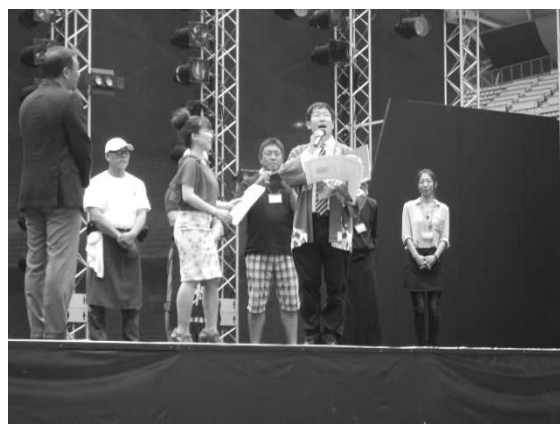
図 16 B級グルメ No.1 決定戦の表彰式