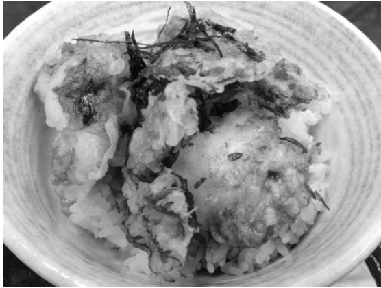
図7 提供されている海鮮天井の例