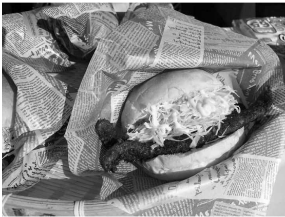
図 12 カマガリバーガー：現在市内でも常時販売している。