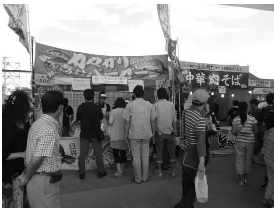
図 15 B級グルメ No.1 決定戦の様子