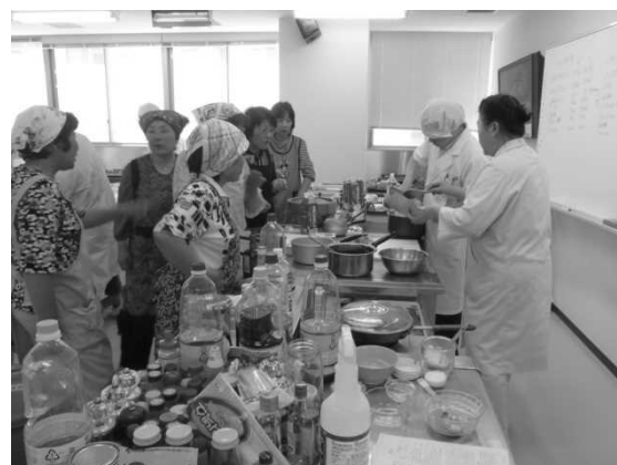
図 19 別府短大での視察研修