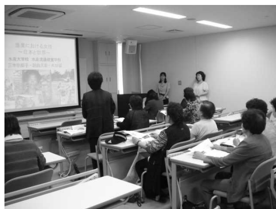
図 18 水産大学校での視察研修

最後になるが、魚食普及活動は漁村女性の使命であり、輝く場でもあることから、今後とも輝き続けていきたい。