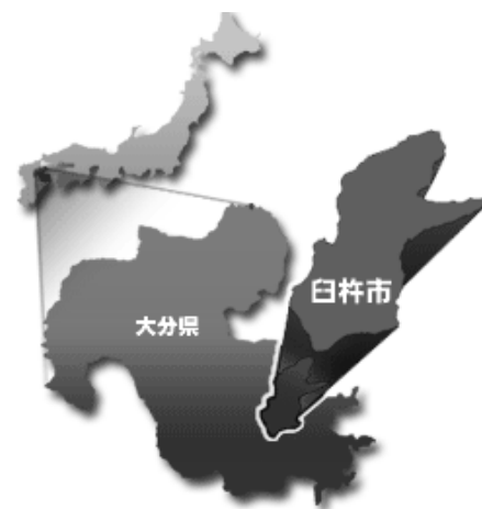
図1 臼杵市の位置図

また、国宝の臼杵石仏や江戸時代末期から発展した醤油・味噌の醸造業などが有名である。