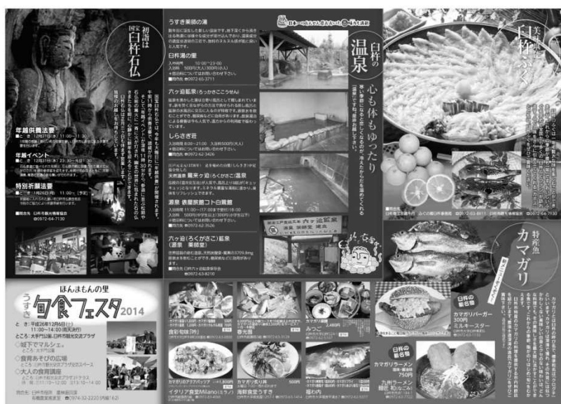
図 17 白杵市観光パンフレット「白杵藩の冬めぐり」(裏面)