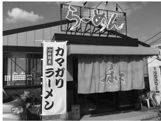
図 13 カマガリラーメンを提供するラーメン店：カマガリのフライをラーメンにのせて提供している。

最近では、タチウオの他、地元では「ご飯を釜ごと借りてきて食べなくてはならないほどおいしい魚」と呼ばれるカマガリ（標準和名クログチ）の加工を始め、漁協・市・県が連携し、積極的にPRをすることで、市内飲食店において、カマガリバーガー（図12）やカマガリラーメン（図13）など、カマガリを用いたメニューが提供されており、白杵市における水産業の活性化を肌で感じる事が出来る。これらの取組は漁村女性の輝く場づくりだけではなく、漁村女性が地域を輝かせた成果であると考えられる。