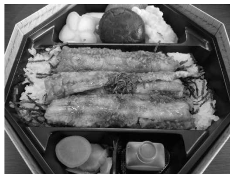
図 14 読売旅行社のチラシと提供された「たち重弁当」：チラシ中央にたち重弁当が紹介されている。