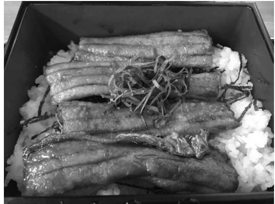
図 11 石仏観光センターうさ味で提供されているたち重