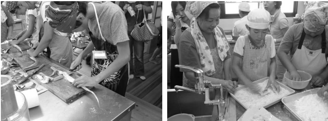
図 3 職人から学ぶ臼杵っこ料理教室の様子

このようにお魚料理教室は、魚に触れ合う機会を提供する場、魚料理を伝える場として効果があると考えられる。