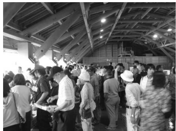
図5 うすき海鮮朝市