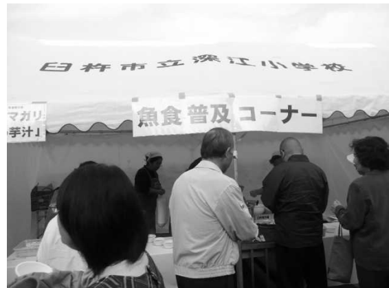
図4 うすき海農朝市

この取組には地元臼杵市にある津久見高校海洋科学学校の生徒も参加しており、女性部員から生徒へのさばき方の技術伝承などの様子も見られている。参加した生徒の中には魚のさばき方などを競う第11回水産海洋高等学校食品技能コンテスト全国大会実技コンテストで優勝する生徒が現れるなど、現場での取組の成果が見られている。