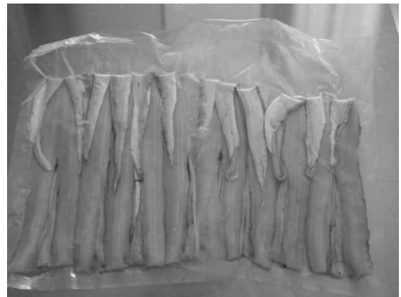
図9 加工したタチウオフィレ

その結果、市内飲食店において、女性部員が加工したフィレを用いたメニュー(「たち重」)を提供するようになった(図11)。このたち重は観光客を中心に大人気メニューとなり、メディアにも大きく取り上げられた。観光客に提供することにより、県内外への臼杵産魚のPRにも繋がっており、魚食普及活動に大きく貢献している。