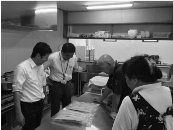
図 10 取引先の社長と協議する女性部員と漁協・県関係者