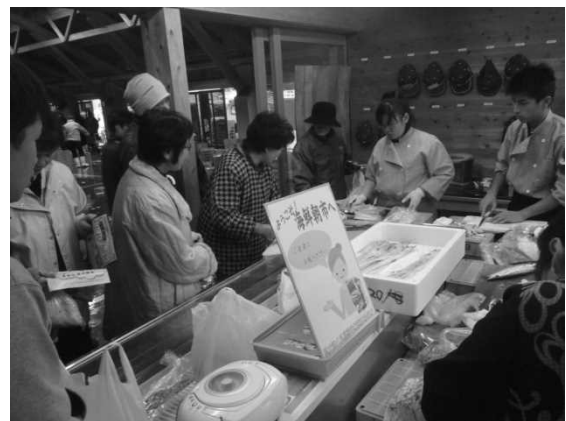
図6 魚さばきサービスの様子