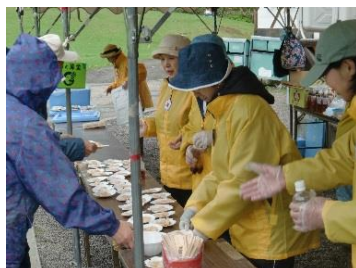
【植樹祭でホタテ配布】

このように、地元への協力活動を通じて広く活動を知ってもらうことにより魚食普及や地産地消に一役買いたいと願って日々活動している。