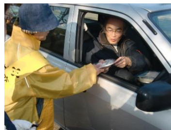
【ヨロコンプで交通安全】