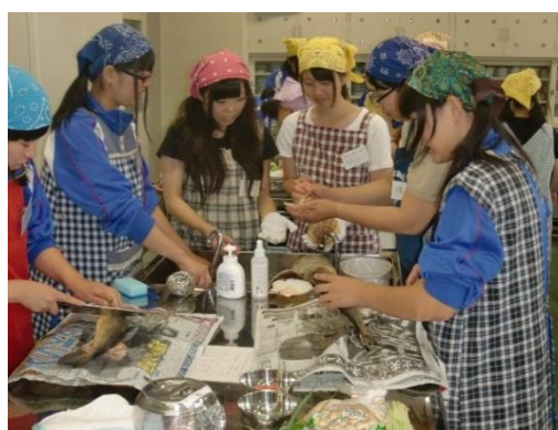
【平成26年度 紋別高校での「浜のお母さん料理教室」の様子】