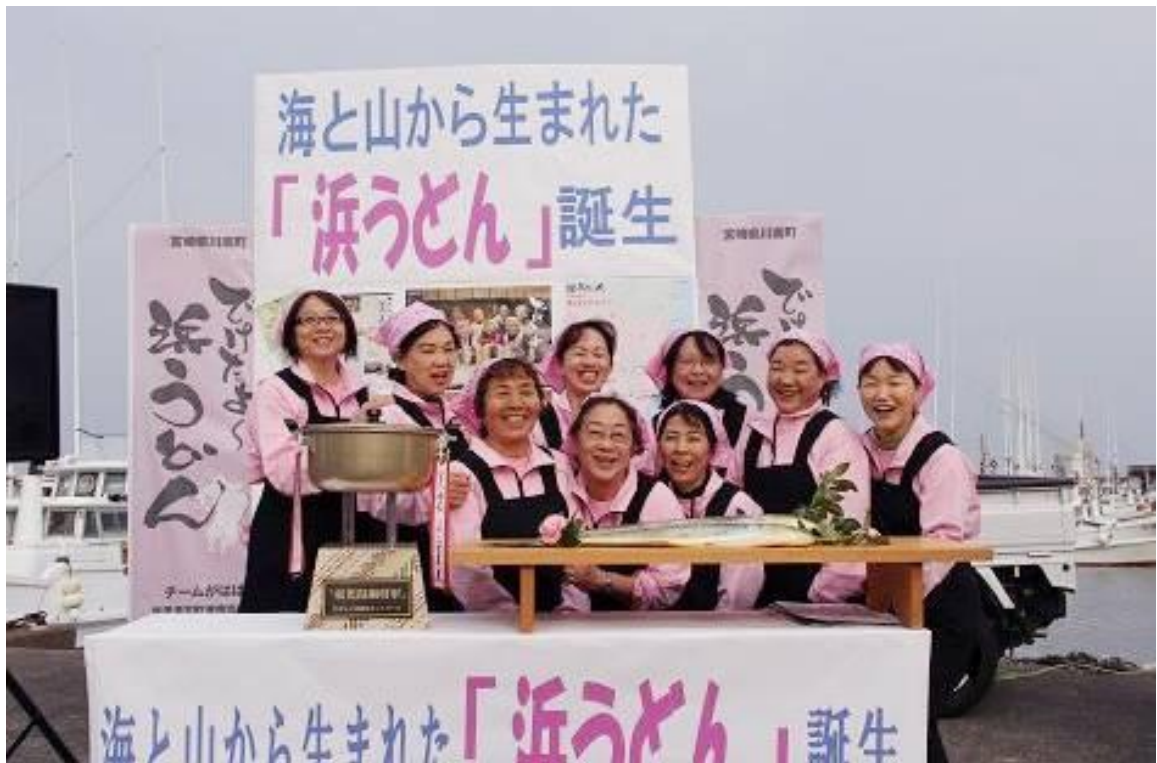
写真1 完成記者会見の様子