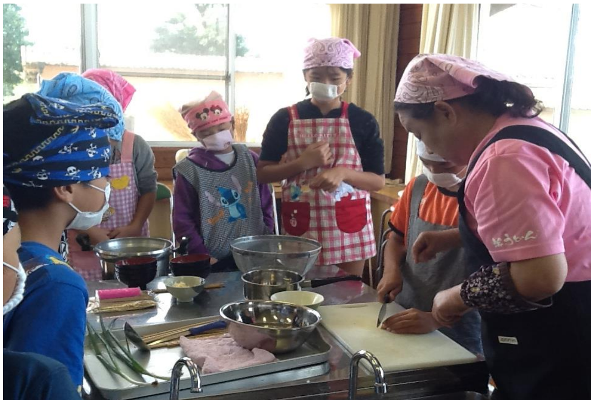
写真2 出前出張での調理実習の様子