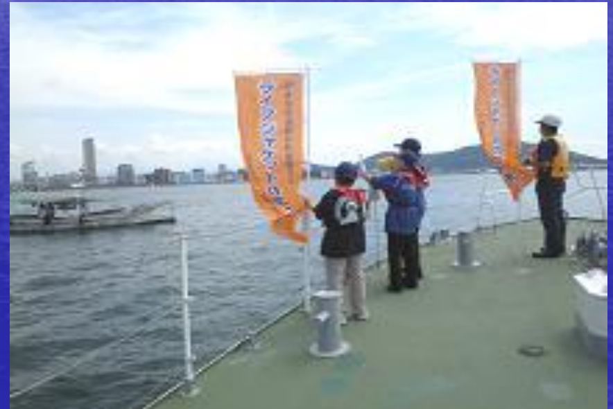
出漁者に着用を呼びかけ