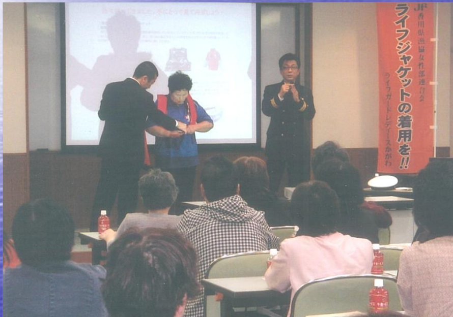
ライフジャケット着用推進講習会