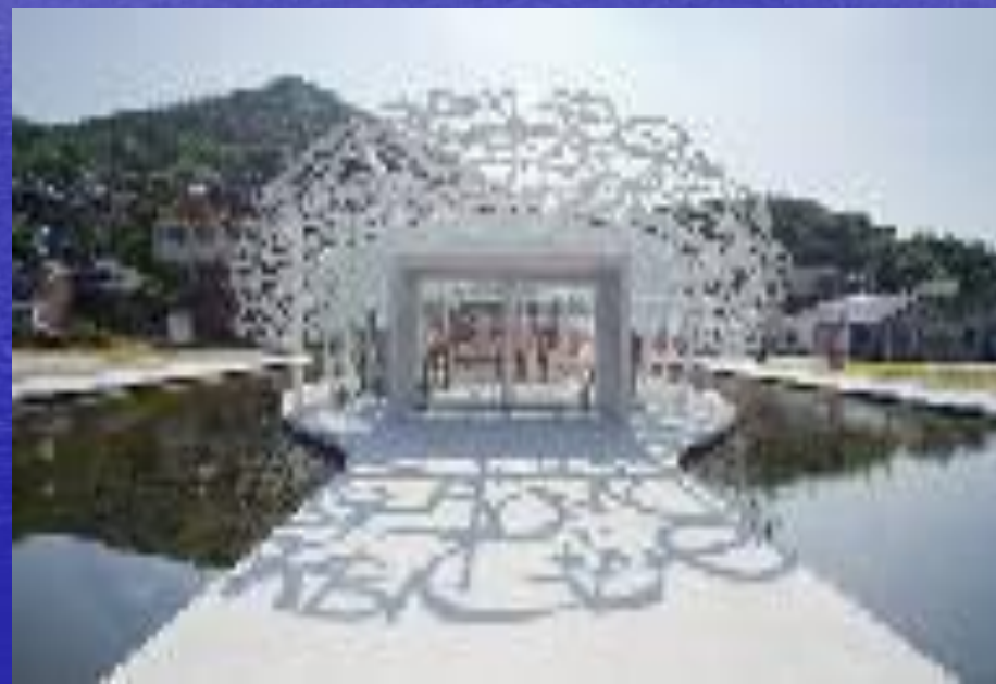
貝の形のアート 男木島交流館