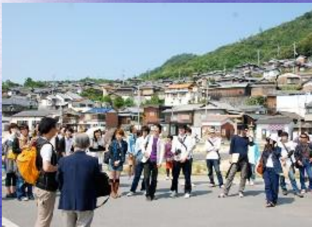
大勢の若者が訪問