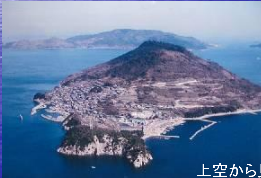
上空から見た男木島