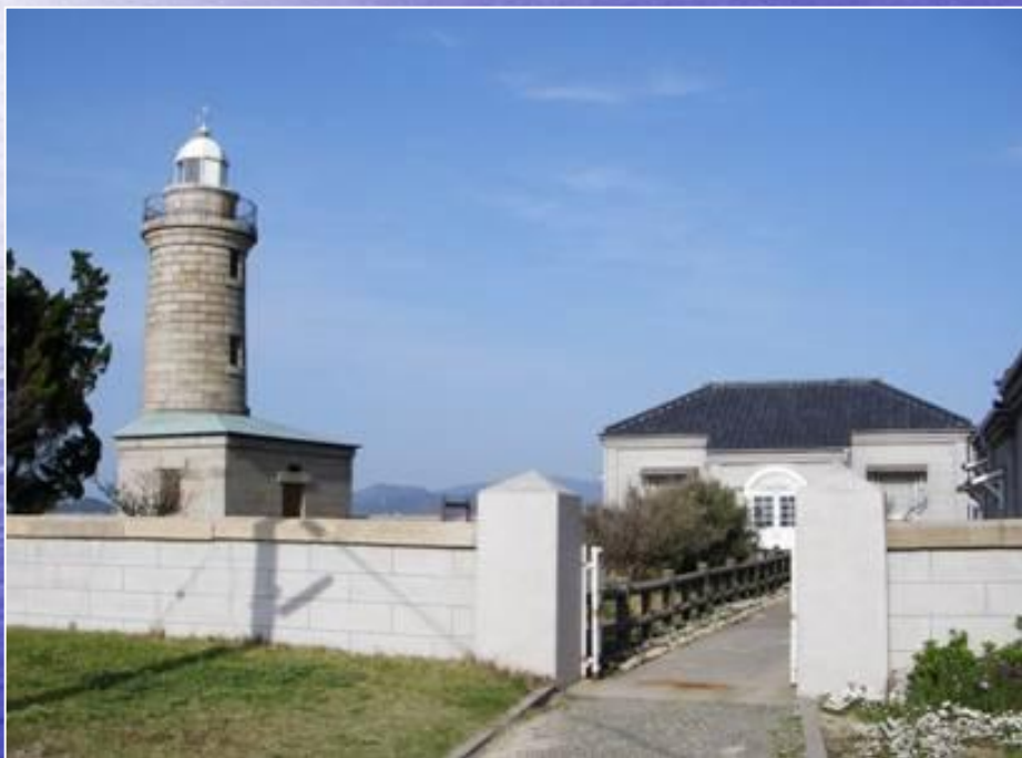
映画の舞台になった男木島灯台