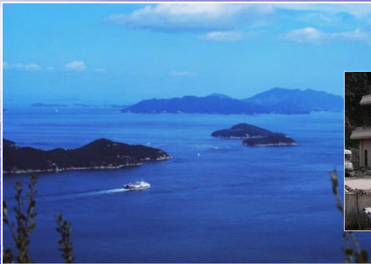
瀬戸内海に浮かぶ 男木島・女木島