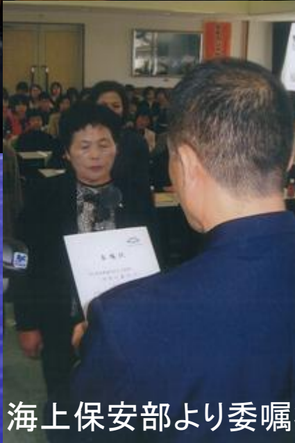
海上保安部より委嘱状の交付