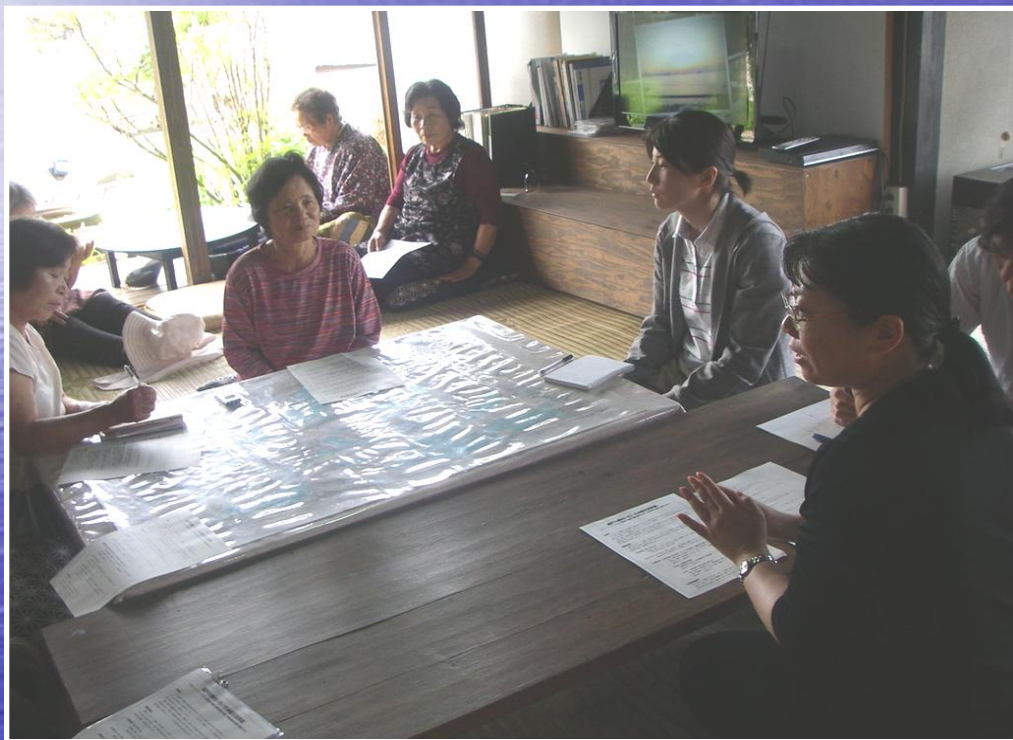
県農村整備課の説明会