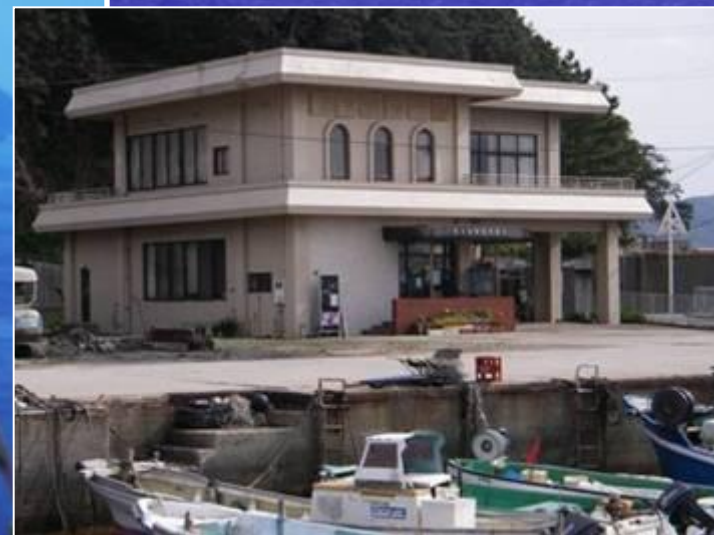
東瀬戸漁協男木支所