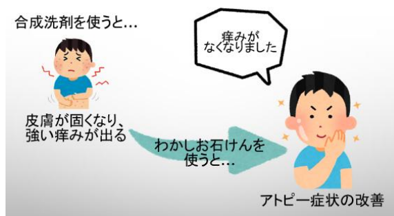
図 7 家庭から排出される生活排水の割合 図 8 わかしお石けんを使用した場合のアトピーの改善イメージ