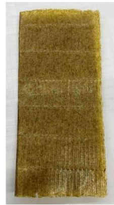
図 6 色落ちした黄色い海苔

の状態が良くなるように、海からの収入で生活している者として私たちが海の為にできることは何か話し合った結果、女性部で長年取り組んでいる「わかしお石けん」の利用推進活動を行うことにした。