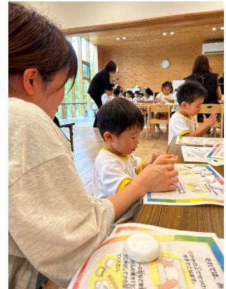
図 11 紙芝居で石けんについて説明している様子 図 12 コネコネマイ石けんを作成している様子