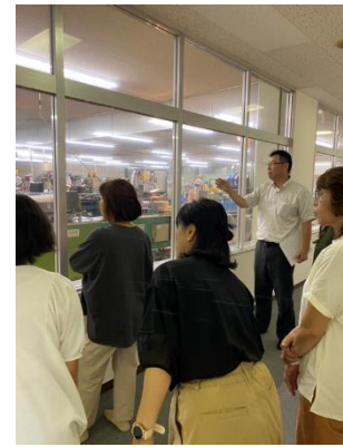
図 5 女性部活動（意見交換、海岸清掃、工場見学）