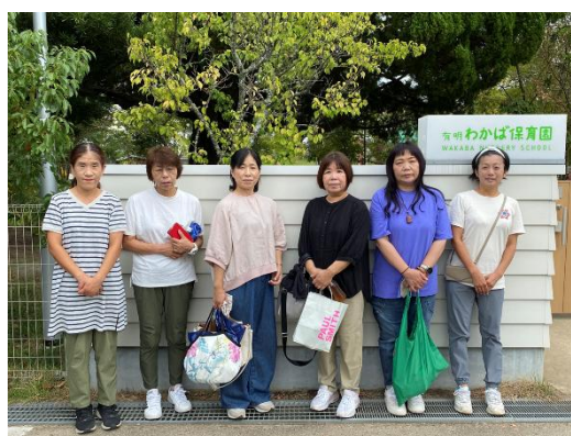
図 9 天然石けん教室の開催

園児たちには少し難しい内容もあったが、五分程の紙芝居を真剣に聞いていた。石けんと合成洗剤について勉強した後、園児たちに楽しく環境に優しい石けんに慣れ