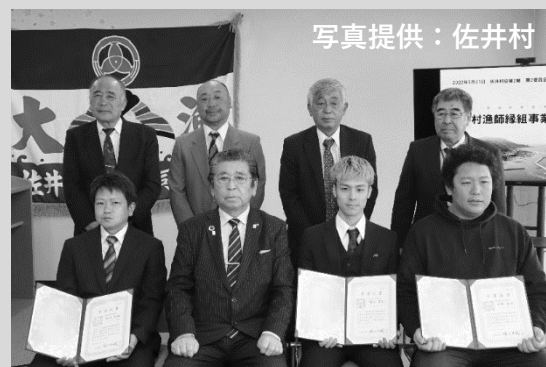
写真2 修了式の様子