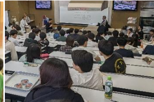
大学・専門学校等での出前授業