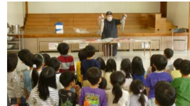
幼稚園・保育園での出前授業