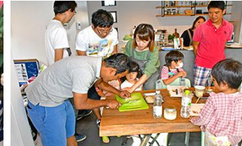
親子料理教室（イベント）