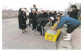
海苔作り体験（課外授業）