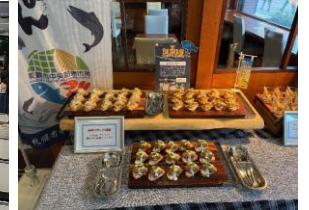
学生考案メニューの提供