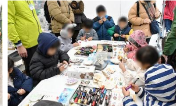
貝殻お絵描き体験（イベント）